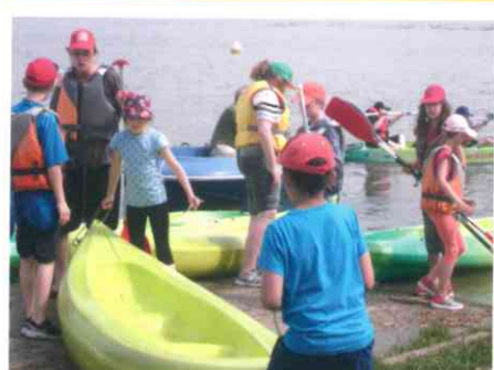
La primaire de Roth à l'étang de Mittersheim,