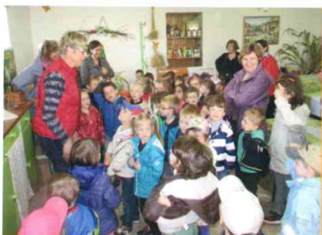
Sortie à la ferme Zellen de Petit-Tenquin pour les Maternelles PS et MS