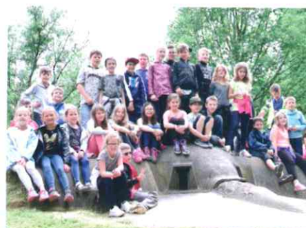
CE2/CM1 A et CE2/CM1 B à Verdun