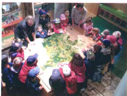
Maternelle GS et CP à la grange aux paysages de Lorentzen