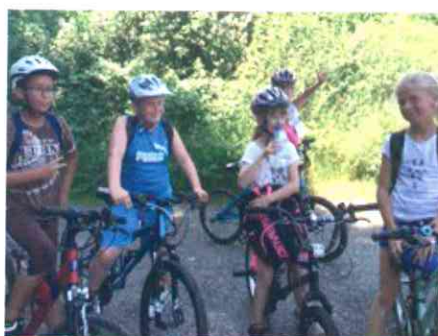
CM2. Sortie à vélo dans les environs de Hambach