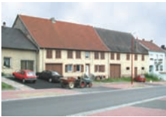
Maisons mitoyennes du centre ancien de Hambach, rue Nationale