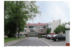
Maison de retraite de Hambach