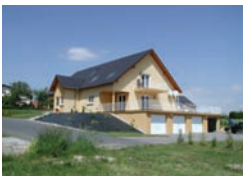
Petit collectif à Hambach, rue Pasteur