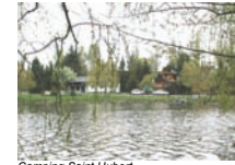
Camping Saint Hubert