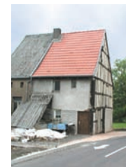
Pignon en pan de bois, parking de l'école