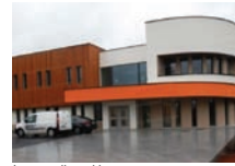
La nouvelle mairie