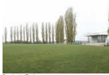
Stade de Roth