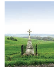
Calvaire, rue de Woustviller