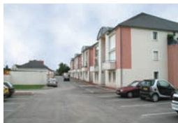
Immeuble collectif à Hambach, rue de Siltzheim

La qualité architecturales des édifices publics, notamment les deux églises, est à relever. L'église de Hambach est un véritable repère visuel dans l'ensemble du village.