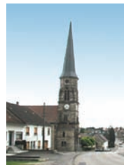
Eglise de Hambach

La commune de Hambach est également caractérisée par un petit patrimoine qu'il est important de continuer à entretenir (croix de chemins calvaires, statues, fontaines...), parce qu'il constitue la mémoire du passé rural de la commune.