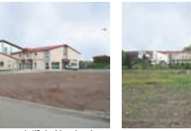
Stade de Hambach

La traversée du village est un élément structurant du centre de la commune. Les aménagements donnent une unité au centre, limitent la vitesse de circulation des automobilistes et améliorent par conséquent la sécurité des piétons.