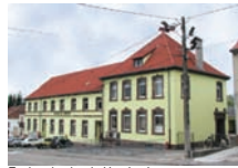
Ecole primaire de Hambach