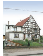
Pan de bois, rue Nationale