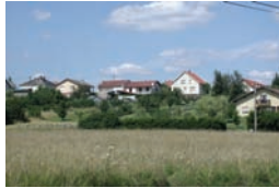
Habitat pavillonnaire sans redécoupage foncier, rue de Püttelange