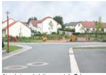
Aire de jeux du lotissement du Tal