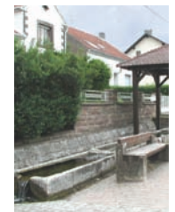
Rue de la Fontaine