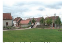
Aire de jeux de l'ancien pressoir à Hambach