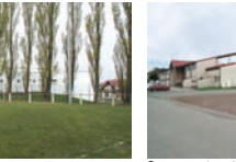
Gymnase et centre associatif de Hambach