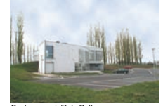
Centre associatif de Roth