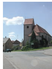
Eglise de Roth