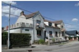
Maisons jumelées à l'angle de la rue de Püttelange et de la rue de la Forêt