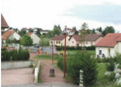
Lotissement du Tal, habitat pavillonnaire