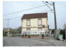
Ecole primaire de Roth