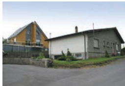
Une touche contemporaine intéressante et une maison des années 1970