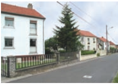
Maisons jumelées de la Cité Belle vue